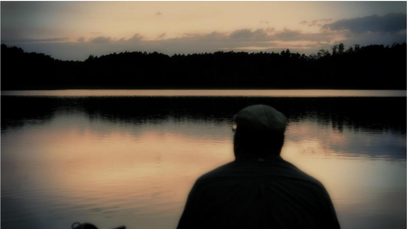
Großer Klobichsee Münchehofe bei Buckow

„IMMER DER NASE NACH“ nimmt die Zuschauer mit auf eine interessante Reise durch die weite Landschaft des Oderbruchs, ein Stück entlang der Oder und über die Märkische Schweiz durch Ortschaften Märkisch-Oderlands. Erleben sie die Schönheit der Natur und entdecken sie beeindruckende Bauten längst vergangener Tage mit neuen Augen. Über drei Monate waren Mario Nieswandt und Frithjof Ritschel für diesen Film unterwegs und machten Aufnahmen an mehr als 13 Drehorten. Heraus kam eine dokumentarische Hommage an ihre Heimat, die nicht nur mit starken Bildern und Musik aufwartet, sondern auch von den Dreharbeiten zum Film erzählt.